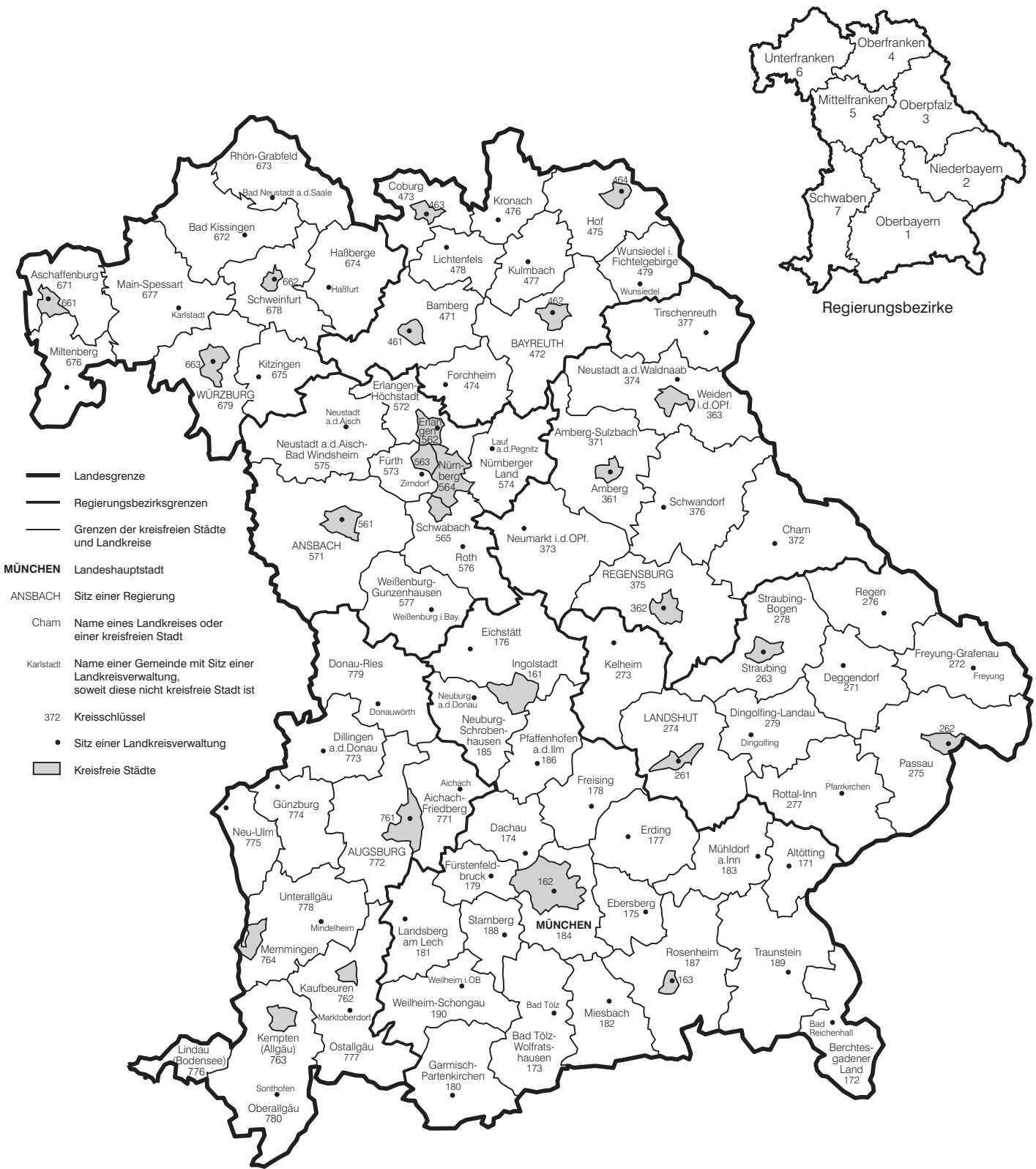
Abb. 1 Verwaltungsbezirksgliederung Freistaat Bayern Kreisfreie Städte, Landkreise und Regierungsbezirke Stand: 31. Dezember 2020